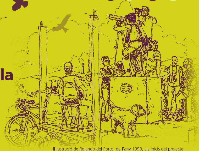
Il·lustració de Rolando del Porto, de l'any 1990, als inicis del projecte